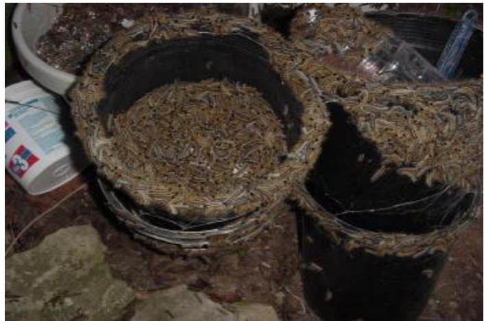
Abb. 1 und 2 Massive Zunahme von Eastern Tent Caterpillars (ETCs) in Kentucky im Jahr 2001, die überall rum krochen, kübelweise eingesammelt werden konnten und vermutlich zu Vergiftungen bei den Pferden führten.