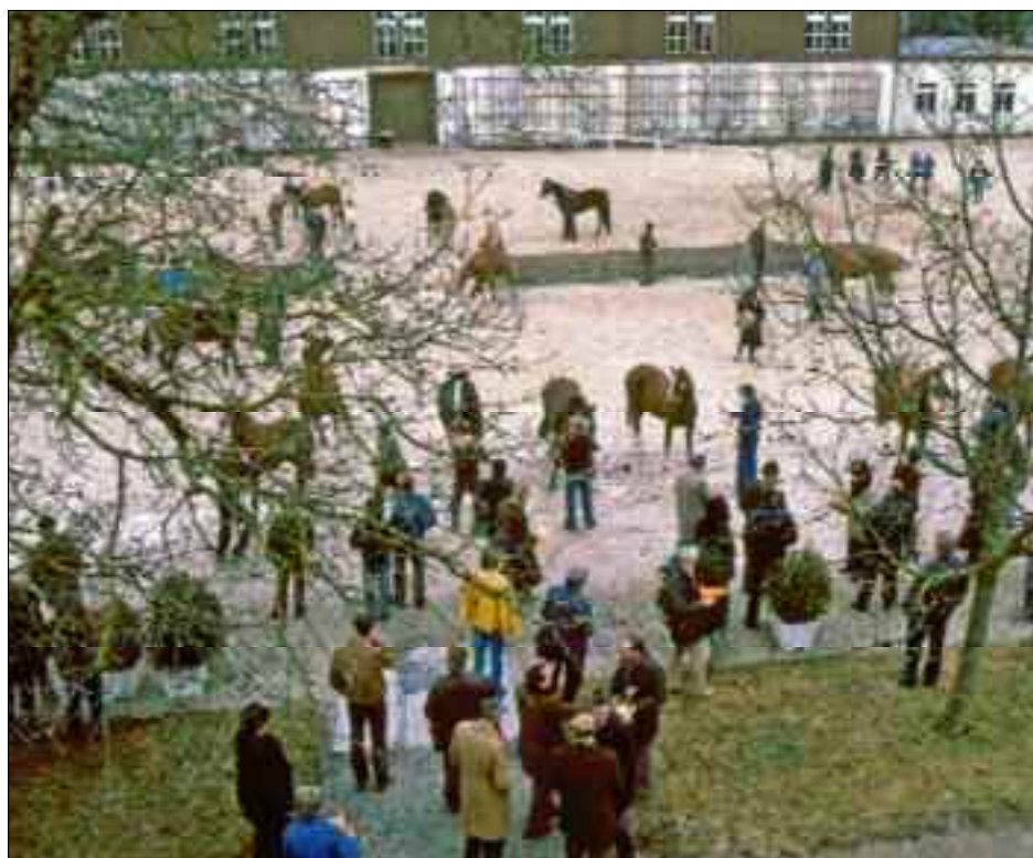
Première présentation de juments poulinières à Avenches.

Il s'en est suivi une période très mouvementée et particulièrement intense au niveau travail puisqu'il s'agissait de restructurer la fédération en tant qu'organisation faitière de toutes les races équinées élevées en Suisse. En 1996 et dans le cadre d'une révision de la loi agraire, la Confédération remettait la direction des organisations d'élevage chevalin. Et si le soutien financier par les pouvoirs publics (Confédération et cantons) était en partie encore assuré, les organisations d'élevage se voyaient attribuer la responsabilité de certaines tâches. Simultanément, les associations des races demi-sang, franchises-montagnes et haflinger voyaient le jour. En 1997, de nouveaux statuts entraient en vigueur et la Fédération suisse d'élevage chevalin devenait la Fédération suisse des organisations d'élevage chevalin FSEC. Celle-ci était destinée à devenir le centre de prestations de service des organisations de races désormais indépendantes