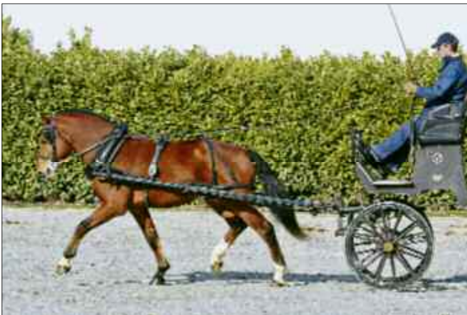
Nino F.W. FM, Siegerhengst am Stationstest 2004.

on dieses Jahres unter anderem entscheiden, ob, wie vom Bundesrat vorgeschlagen, nur noch die Freiburgerzeitung unterstützt werden soll. «Sollte dieser Teil der Botschaft im Parlament nicht zurückgezogen werden, wird der Schweizer Pferdezeitung der Boden vollends unter den Füßen weggezogen.» Dies die absolut zutreffende Feststellung des VSP-Präsidenten.