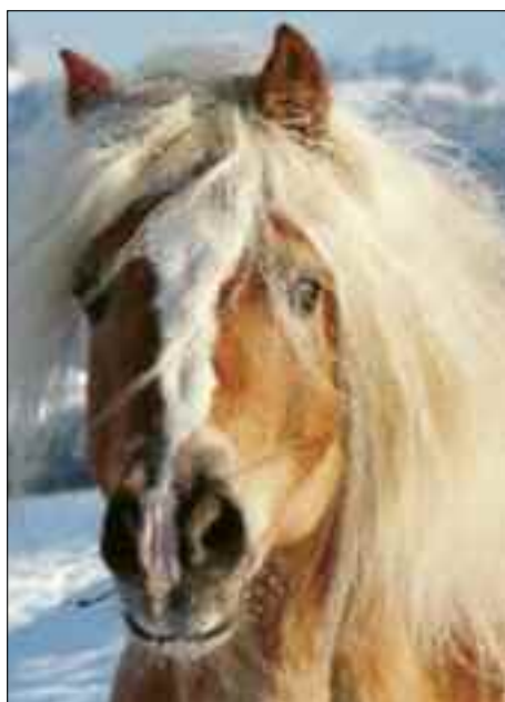
Aragon, Haflinger-Siegerhengst an der Körung 1994.

Pferdezucht. Aus einer professionell musste eine ehrenamtlich betriebene Geschäftsstelle mit Sitz in Staffelbach gemacht werden, kein leichtes Unterfangen innert kurzer Zeit. Es war eine aufreibende und undankbare Aufgabe, zumal noch erhebliche Altlasten loszuwerden waren, auf die hier nicht näher eingetreten werden soll. Im März 2006 genehmigte die Delegiertenversammlung neue Statuten, und im September gleichen Jahres fanden ein neu erarbeitetes Leitbild und die formulierte Politik des Dachverbandes die Zustimmung einer Präsidentenkonferenz. Dazu sei aus dem offiziellen Bericht zur DV 2006 zitiert: «Symbolhaft läutete der erste schöne Frühlingstag dieses Jahres eine neue Ära beim Dachverband ein. Der Vorstand des VSP und die Delegierten und Gäste erhoben beim anschliessenden Apéro das Glas auf das gemeinsame Ziel, eine geeinte Schweizer Pferdezucht.» Bereits an der Delegiertenversammlung 2007 kam es dann aber zu einem Eklat, indem der grösste Rassenverband, der Schweizerische Freibergzuchtverband, «mangels gelebter Solidarität mit der übrigen Pferdezucht und Pferdewelt sowie Einsicht in begangene Fehler» (Jahresbericht) aus dem Dachverband ausgeschlossen wurde. Mit der Aufnahme der Schweizerischen Interessengemeinschaft Esselfreunde und der Pferdezuchtgenossenschaft Aargau als ausserordentliche Mitglieder in der zweiten Jahreshälfte verpflichtete sich der VSP allerdings, nicht nur die Interessen der Esselfreunde, sondern auch «von Freibergzüchtern» wahrzunehmen.