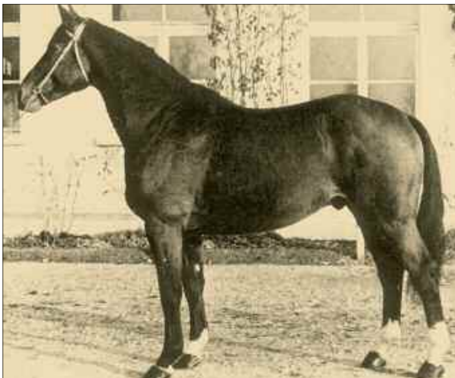
Que d'Espoir, l'un des étalons de pointe importés déjà très tôt.

Malgré d'énormes efforts également dans le domaine de la commercialisation, la mise en place de l'élevage des demi-sang progressait avec peine durant les années 70 et il semblait très difficile d'améliorer l'image du cheval de sport CH. Il en allait tout autrement des franchises-montagnes dont l'amélioration portait ses fruits et qui provoquait également un intérêt international. La sur-